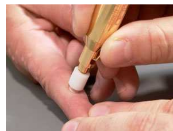
L'adaptateur de contact